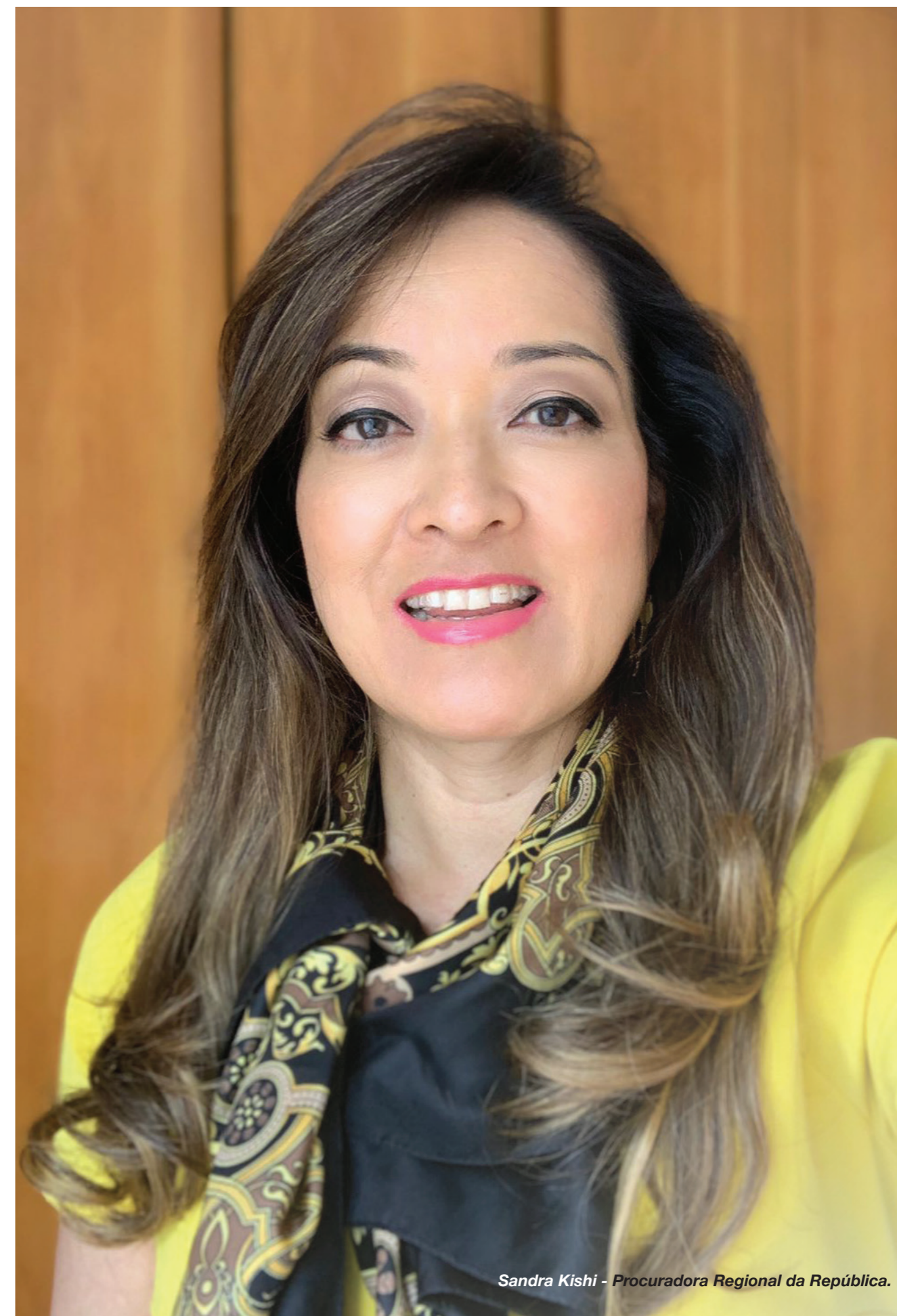
Sandra Kishi - Procuradora Regional da República.

É fundamental que ocorra essa sinergia, em que o Ministério Público é um ator para cuidar da mediação e da articulação de todos esses atores para é atingir esse objetivo da segurança da água, sendo algo que envolve gestão de riscos à saúde pública, riscos à saúde ambiental, olhando para os contaminantes emergentes que estão na água e que não são amortizados, nem eliminados com a tratabilidade convencional dos nossos sistemas de tratamento de a água.